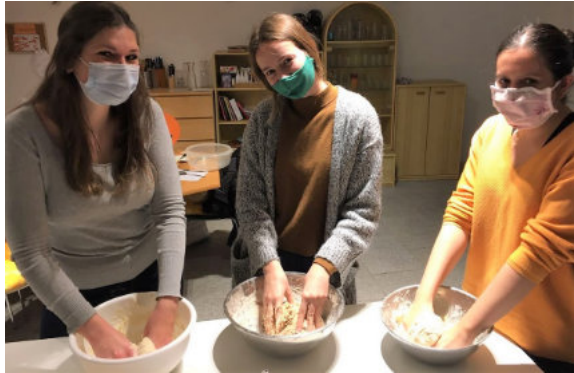
Beim Solidarity Bread wird fleißig geknetet